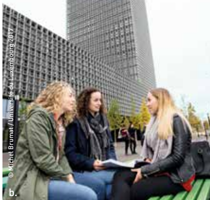
© Michel Brumat / Université du Luxembourg, 2017