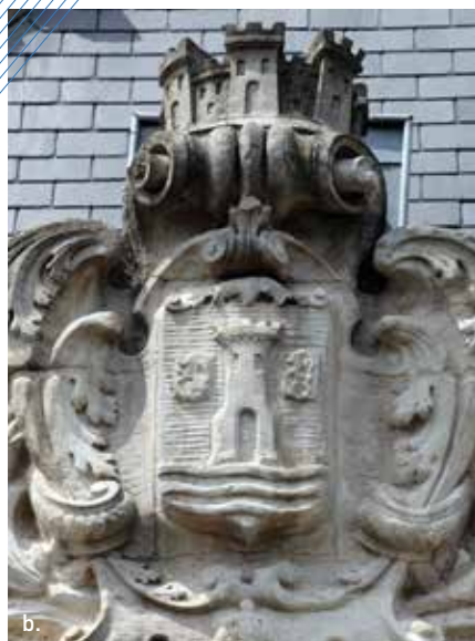
a. Akademieplatz, Place de l'Académie b. Wappen der Stadt Esch, Lycée de Garçons b. Rathaus